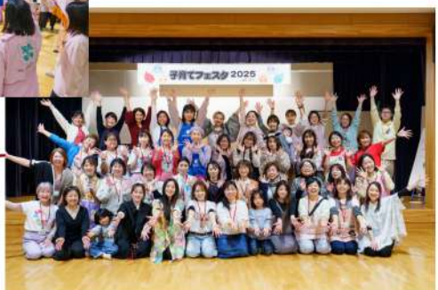
2025年子育てフェスタ実行委員会