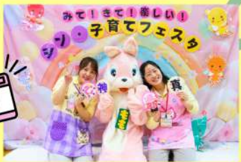
▲写真は昨年度のもです。